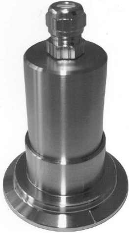
Oprawa oświetleniowa Micro LED, TYP MVL R 2 LED , 2 W, 24 V AC / DC, zamontowana na metalowym wzierniku „Fused” TriClamp ® złącza DN50 PN1