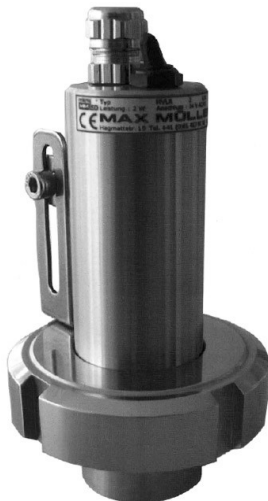
Oprawa oświetleniowa Micro LED TYP MVL R 2 LED E Sch1 , 2W, 24 V AC / DC, z wbudowanym przełącznikiem ON-OFF "E", zamontowany na VETROLUX wzierniku skręcany wg DIN 11851, DN 32, PN 6