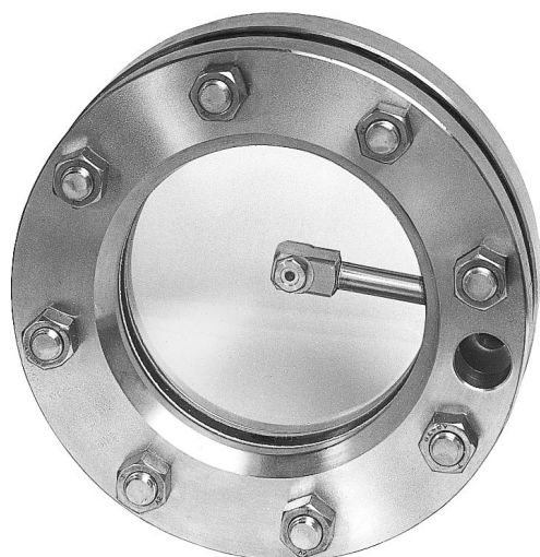
Dysza rozpylająca typu SV4 wbudowana w wziernik podobny (na podstawie) DIN 28120, DN 125, PN 6.